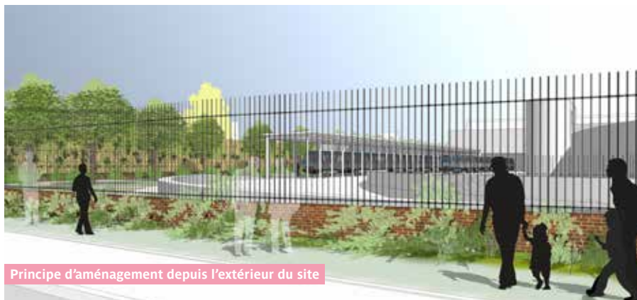
Principe d'aménagement depuis l'extérieur du site

François Bornet, représentant de la maîtrise d'ouvrage RATP